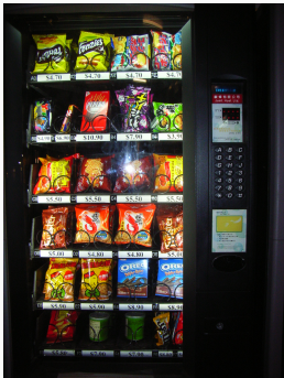
Figure 1: Abstraction

Quelles sont les différences entre abstraction et encapsulation ?