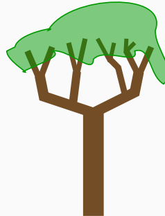
Figure 2: Encapsulation